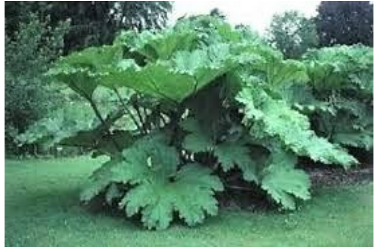
gunnera of mammoetblad

Op de website van de tuin is een leuk historisch filmpje te zien ( https://www.tuinschoonoord.nl/video ). Wandelend en luisterend naar de gids merkten we dat het weer opklaarde en kwam zelfs de zon tevoorschijn. En ondanks dat weinig planten nog bloeiden, was er veel te zien wat de moeite waard was, zoals bijvoorbeeld de enorme gunnera of mammoetblad, de Libanon ceders, de moerascypres met zijn "krietjes" en de blauweworstenboom.