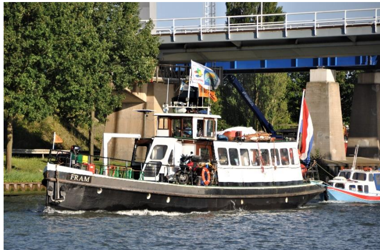
De FRAM op het Amsterdam-Rijnkanaal 2015

Met vriendelijke groet, Het bestuur van vereniging De Carnisse Grienden.