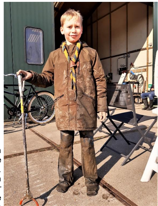
De (jonge)man die terugkwam zonder laarzen....

Ook Tafelronde 154 Rhon vindt het belangrijk om zich in te zetten voor lokale goede doelen en steekt ook graag zelf de handen uit de mouwen. Daarom nam de Tafel het voortouw bij de Rhoonse grienden. Na de voorbespreking met koffie en wat lekkers gingen de groepen enthousiast op pad met vuilniszakken en grijpers. Na een anderhalf uur struinen en tientallen vuilniszakken verder, werd de opruimactie afgesloten met soep en broodjes en voor de kinderen een opruimdiplooma. Zoals ieder jaar een geslaagd avontuur.