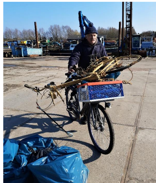
Complete fietsen kwamen boven water!!