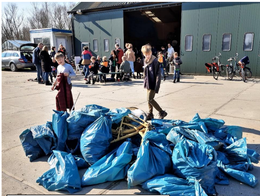
Verzameld afval met de scouts op de achtergrond bij de loods van Kraaijeveld