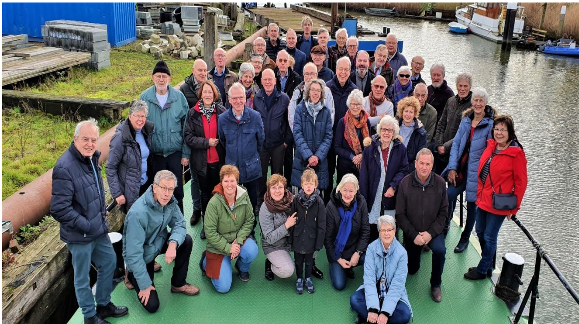
De gebruikelijk foto na afloop van de Nieuwjaarsreceptie 2020