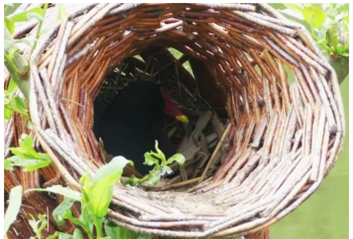
een broedende waterhoen in een eendekorf

De laatste jaren zien we op allerlei plekken eendekorven opduiken in Albrandswaard. Kijkt u maar eens om u heen tijdens een wandel- of fietstocht. In vele sloten staan deze kunstwerkjes, alles bij elkaar misschien wel honderd. Een eendekorf wordt gevlochten van wilgentenen. Vroeger vervaardigde men op deze wijze allerlei voorwerpen, zoals manden, fuiken en stoelen. Dit fraaie staaltje Hollandse traditie is tegenwoordig echter een grotendeels verloren ambacht. In de eendekooi van Klein Profijt kunt u nog wel leren hoe het moet. Zoals de naam doet vermoeden hebben deze korven tot doel om broedende eenden onderdak te bieden. Uit nieuwsgierigheid controleerde ik zo nu en dan eens zo'n korf, maar telkens was de korf leeg.