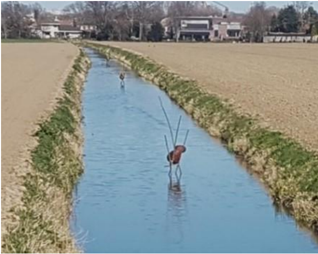
eendekorven in de Tweede Schenkel in Polder Albrandswaard

Afijn, we kunnen de korf altijd nog omdopen tot kippenkorf.